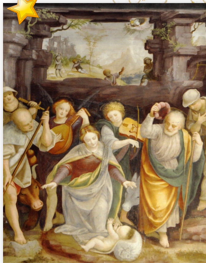
NATIVITA' (Bernardino Lanino) - Cappella Maggiore Basilica San Magno - Legnano

appuntamento dal 16 dicembre 2022 al 6 gennaio 2023